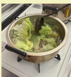
最後にレタスを入れて完成