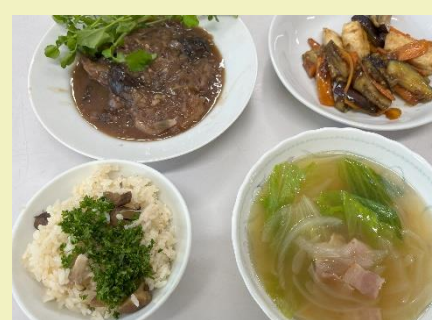
おー、これはレストランだ。