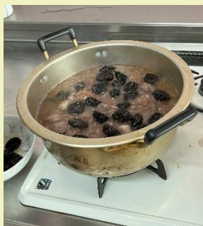
あとはプルーンを入れて煮込めばOK