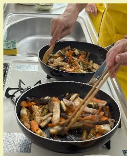
味見しながら、濃すぎないように注意して。