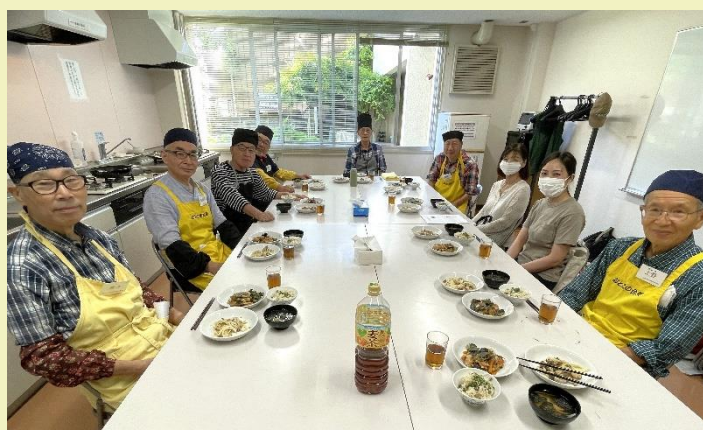
第1火曜日に、あんしんすこやかセンターのお二人がご参加