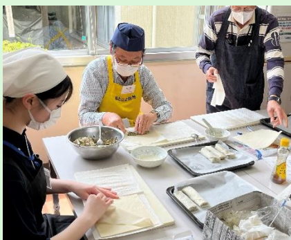
春巻き、巻き方うまいね。 いつもよりメンバーの手と 口が動いています。