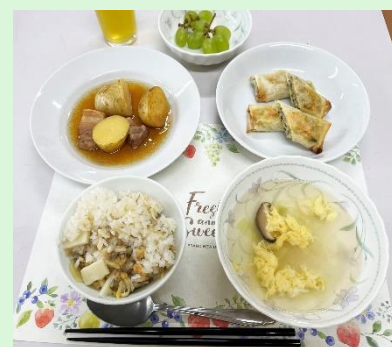
みんな満足の出来栄え。 デザート付き！ ランチョンマットも用意。