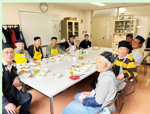
第 3 火曜日には至誠会の学生さんが参加です。