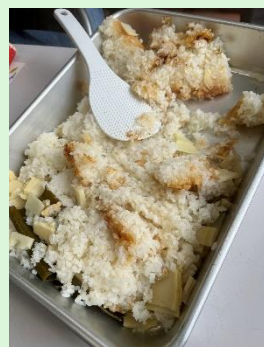
いいんじゃない。 おこげの具合も。