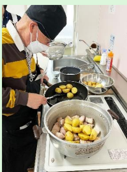
フライパンで炒めて 鍋に移して、量が 多いね。