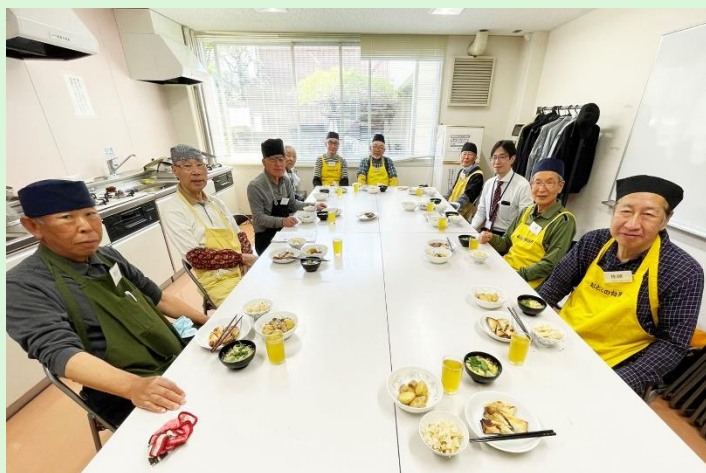
第 1 火曜日は社協の方が参加です。