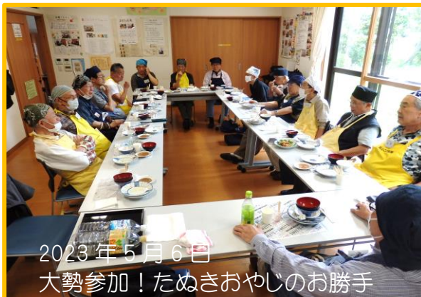
2023年5月6日 大勢参加！たぬきおやじのお勝手

しているかな？砧の台所は6月3日(土)「晴れたらGピク」、13日(火)、27日(火)です。ぼんぼこポンでワイワイ料理！ガヤガヤ会食？平常に戻ったかな~(^.^)