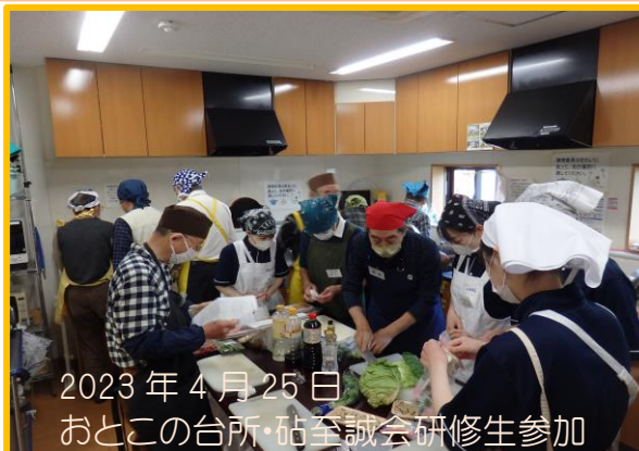
2023年4月25日 おとこの台所・砧至誠会研修生参加

の「兜セレブレーション」量産月でしょう。そんな気がします。砧の台所は5月6日(土)、9日(火)、23日(火)です。楽しく！ チョット爺(G)パーティー(PT)?