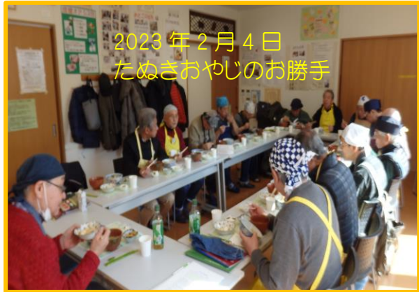
2023年2月4日 たぬきおやじのお勝手

砧の台所は3月4日(土) 14日(火)28日(火) デザート付きは継続中！ 是非ご参加を！