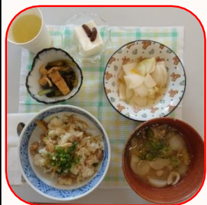
定例料理2023年2月14日10名&28日11名)