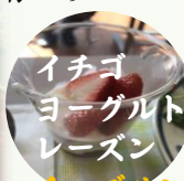
イチゴヨーグルト

しかも、第二火曜日は焼いた餅にノリを巻いて、第四火曜日はプロバンス風餅をもう一枚、それぞれ追加😊