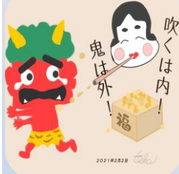
吹くは内！ 鬼は外！ 福