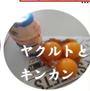
ヤクルトとキンカン

たぬきおやじの腹も料理が沢山！お腹がいっぱいになりました😊 デザートはヤクルトとキンカンとテイクアウトでもOK👍