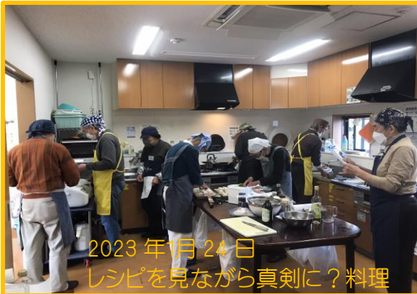
2023年1月24日 レシピを見ながら真剣に？料理