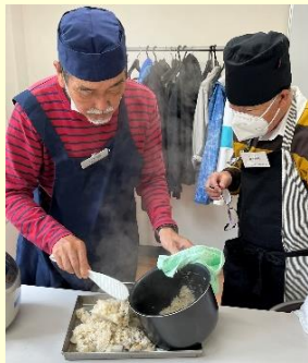
炊き込みご飯が出来ました。