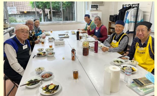
では、いただきます！