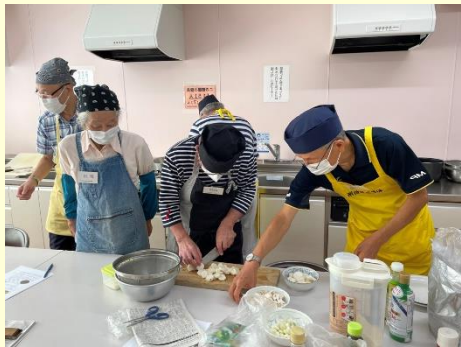
里芋をまず切って。

9月は休会でしたが、10月は元気に再開となりました。今回は3品に汁物を加えました。