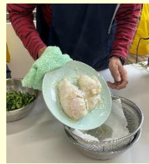
鶏肉は電子レンジで加熱してだしは汁物に