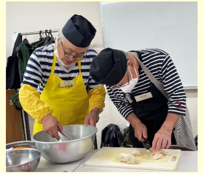
鶏肉をうまく切るのには難しいね。