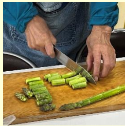
アスパラを同じ長さに切って