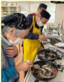
アクアパッツァはよく出来たかな