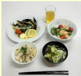
料理が出来ました。おいしそうです。