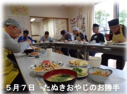
5月7日 たぬきおやじのお勝手

6月4日(土)・14日(火)・28日(火) フルーツのデザートがついています 是非、ご参加ください。(失言撤回)