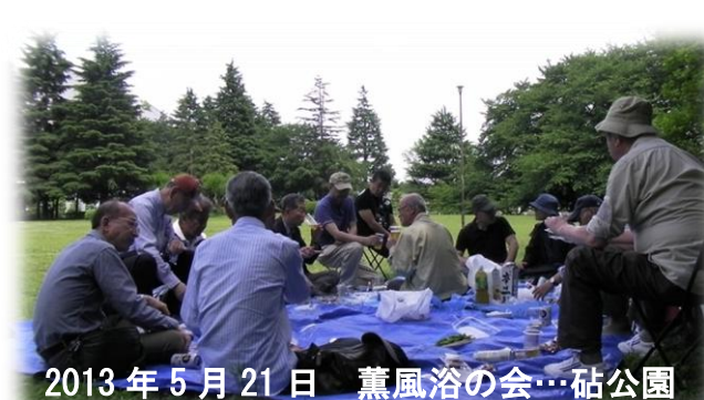
2013年5月21日 薫風浴の会…砧公園