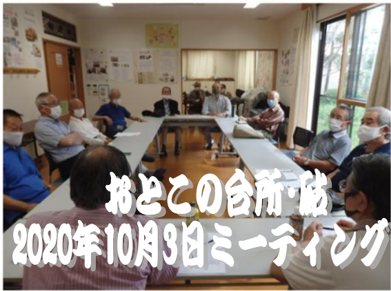
おとこの台所・砧 2020年10月3日ミーティング

※おとこの台所ホームページ おとこの台所 検索 グループニュース・各台所だより・活動の歴史 etc