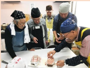
「ミートローフはこんな風にベーコンを巻いて」