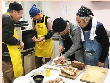
「ミートローフ大きいからうまく切るの難しいなー」