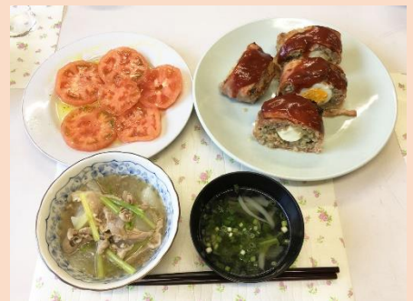
「なかなか上手く出来たね！おいしそうだね！」