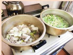
「かぶの葉っぱと皮をお汁に。」