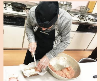
「このゆで卵、でかいなあ！」