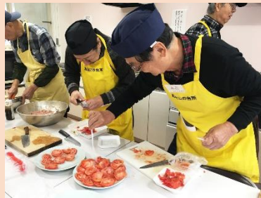
「砂糖をかけるのは初めてだあ！」