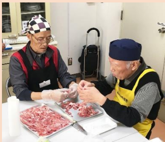
「豚肉分けるのなかなか手間だね。」