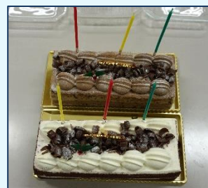
デザートの「シフォンケーキ」