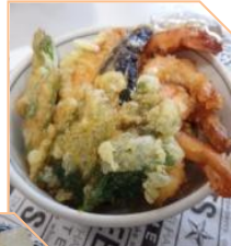
焼き野菜の特盛り天井 (写真上)

ブルーケもそれなりに綺麗！ (写真下) 流行りのインスタ映え？ 食欲増進！自己満足の料理に納得、満腹♪♪♪