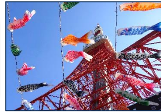
東京タワーと鯉のぼり