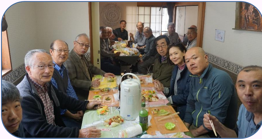
花見会のスナップ

この撮影はシンガポールの今後の高齢化社会を意識して、日本でのリタイヤ後の活動を取材するもので、シンガポールで放映されます。